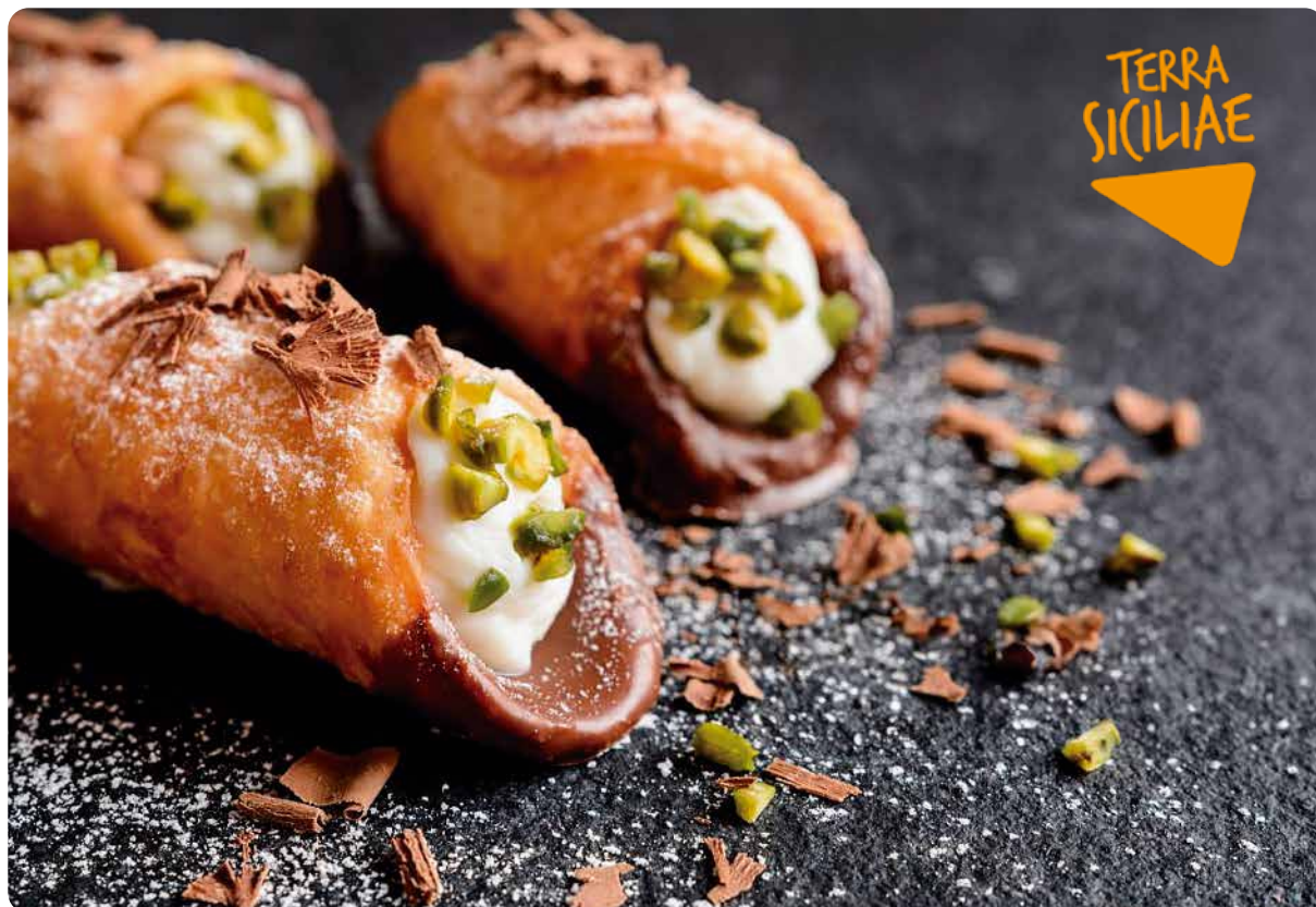
CANNOLI SICILIANI MIGNON 10PZ