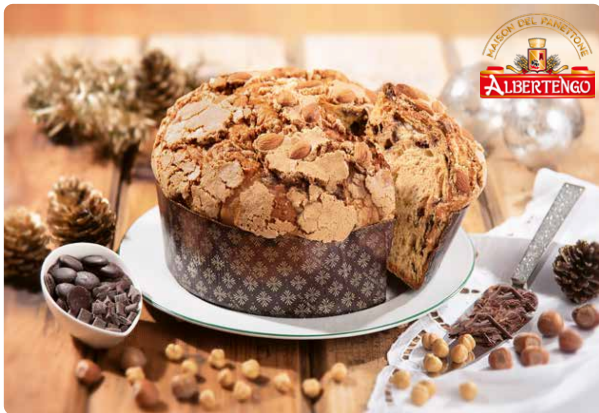
PANDORO ORO RIFLESSI