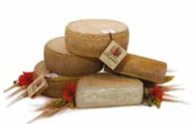
IL VERO SCOPAROLO