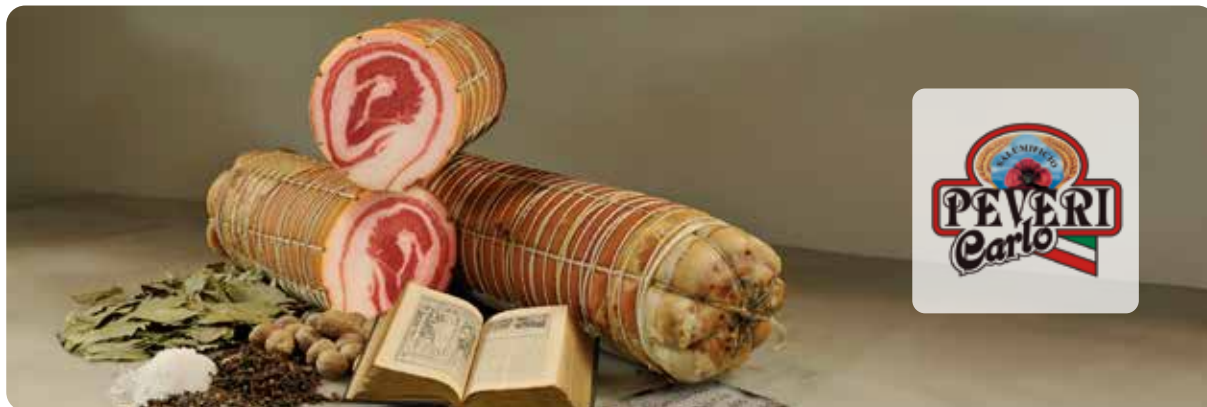
FIOCHETTO FONTI 1/2