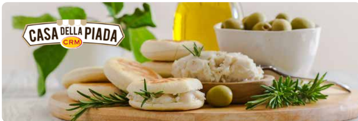
PIADA SFOGLIA EXTRASOTTILE 3PZ