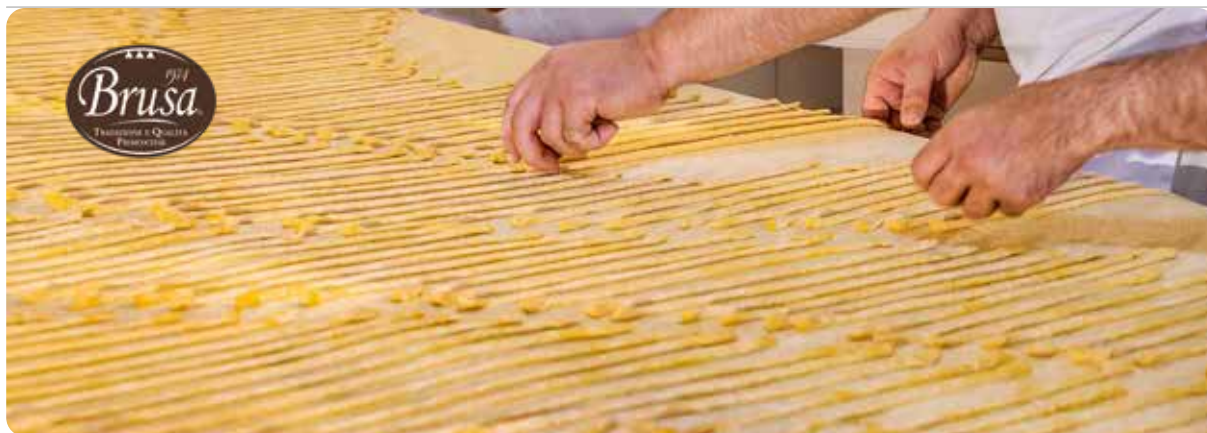
GRISSINI ARTIGIANALI PIEMONTESI