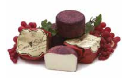
MINI CACIO DIVINO