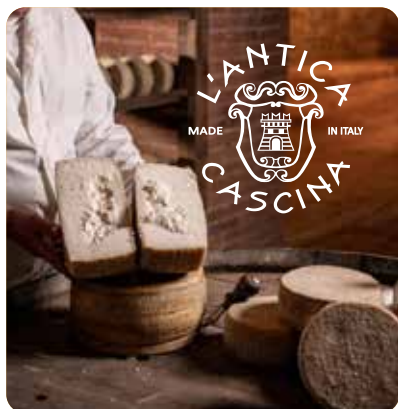
FORMAGGIO DI FOSSA