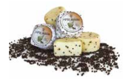
MINI PIPER NIGRUM