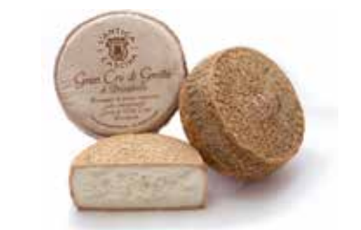
GRAN CRU DI GROTTA