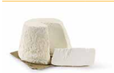
RICOTTA DI PECORA